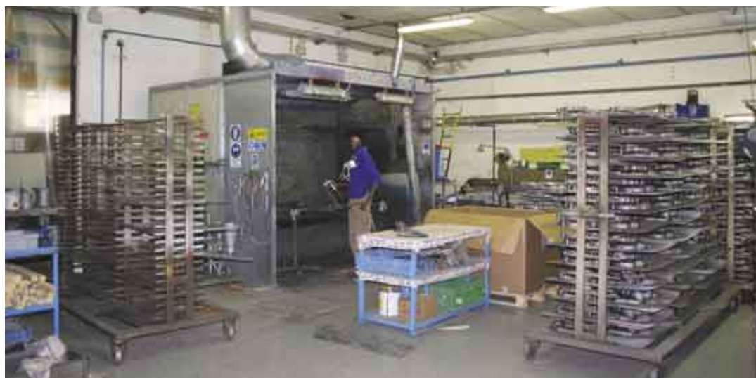
Fig. 3 - Il reparto di verniciatura liquida manuale