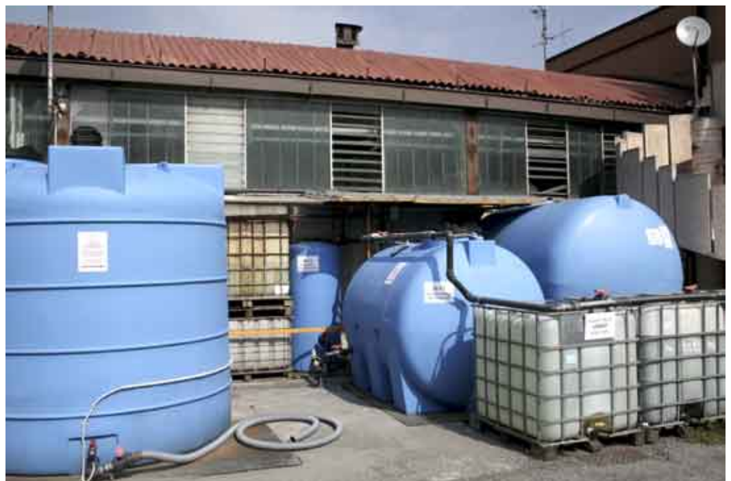
Fig. 10 - La zona con i serbatoi di decantazione, a sinistra, di neutralizzazione al centro e di accumulo bagni attivi esausti a destra

come risciacquo finale dei trattamenti, come del resto indicato nelle specifiche dei capitoli dell'industria dell'automotive. I reflui ai punti 1 e 2, insieme agli eluati prodotti dal demineralizzatore, vengono invece raccolti rispettivamente nei serbatoi B10 e B11 (fig. 10) e da lì convogliati alla neutralizzazione (serbatoio B12) e poi allo stoccaggio, serbatoio (B20) per l'evaporatore sottovuoto a compressore volumetrico (fig. 11). Dopo la concentrazione, il distilla-