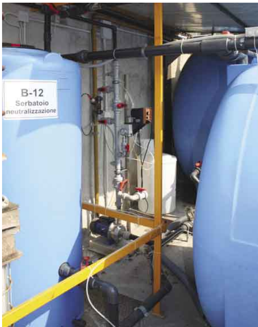
Fig. 13 - Il gruppo di valvole automatiche della neutralizzazione